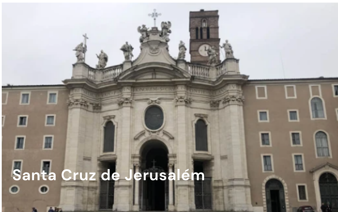
Santa Cruz de Jerusalém