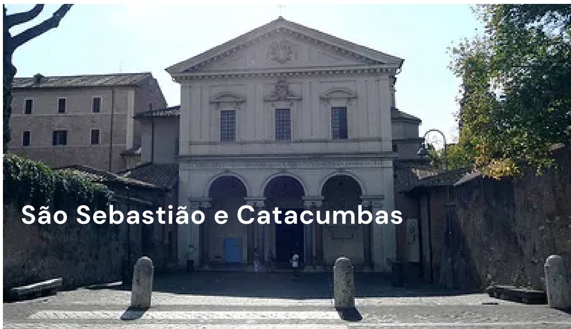
São Sebastião e Catacumbas