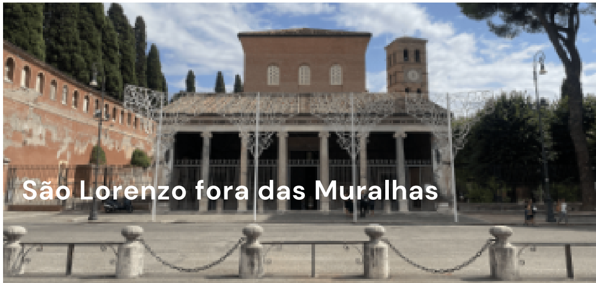
São Lorenzo fora das Muralhas